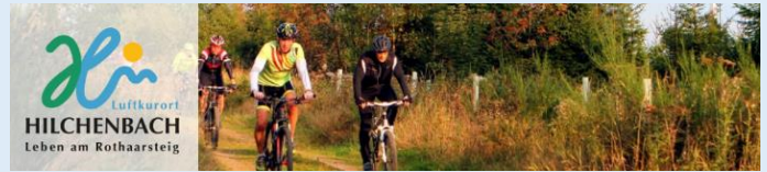
Wandern, Radfahren, Theater, Kino und vieles mehr

Die evangelische Kirchengemeinde Hilchenbach hat 4.800 Mitglieder und zwei volle Pfarrstellen; die Nachbargemeinde Müsen 2.500 Mitglieder und eine volle Pfarrstelle. Beide arbeiten eng zusammen. Ab Juli 2024 stehen zwei hauptamtliche Pfarrstellen für die Arbeit der beiden Kirchengemeinden zur Verfügung. Vor diesem Hintergrund ist ein Strukturwandel zu gestalten.