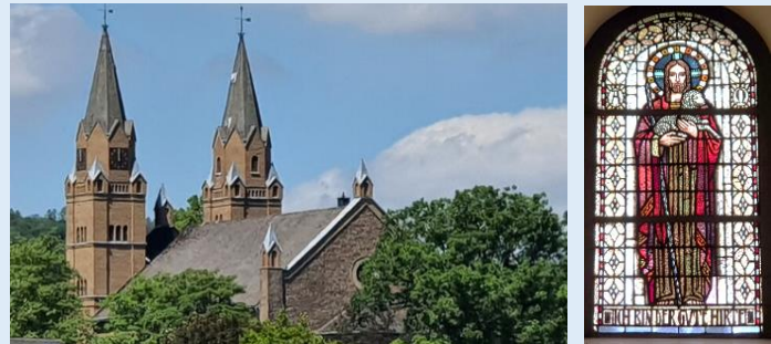
Die schöne Kirche prägt das Stadtbild