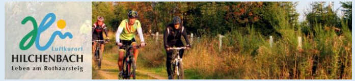
Wandern, Radfahren, Theater, Kino und vieles mehr

Die evangelische Kirchengemeinde Hilchenbach hat 4.800 Mitglieder und zwei volle Pfarrstellen; die Nachbargemeinde Müsen 2.500 Mitglieder und eine volle Pfarrstelle. Beide arbeiten eng zusammen. Ab Juli 2024 stehen zwei hauptamtliche Pfarrstellen für die Arbeit der beiden Kirchengemeinden zur Verfügung. Vor diesem Hintergrund ist ein Strukturwandel zu gestalten.